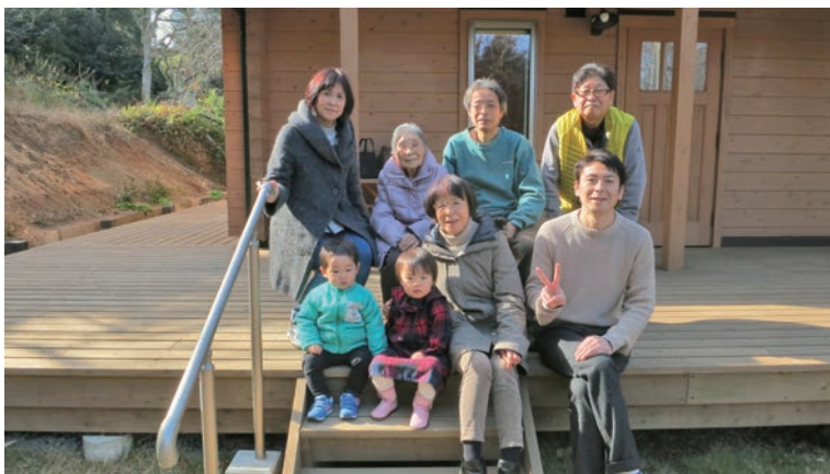
ひ孫も交えて（平成 30 年正月）