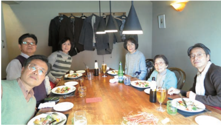
子供たちとの食事会（平成 27 年末）