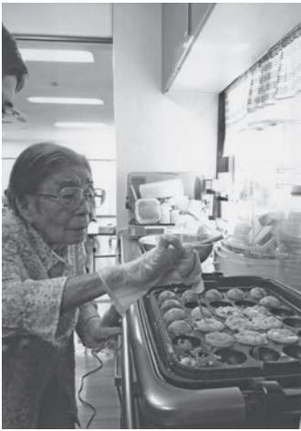
西新デイサービスにて