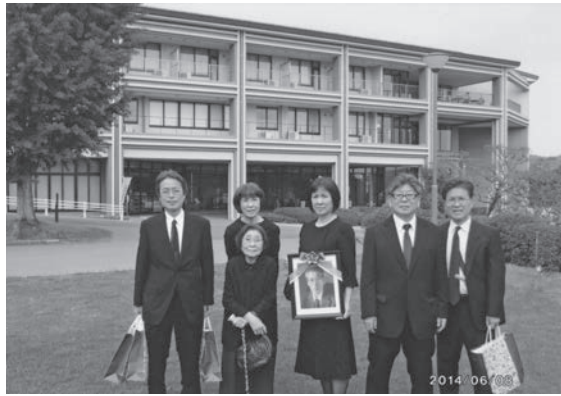
夫・四十九日の法要時（平成 26 年）