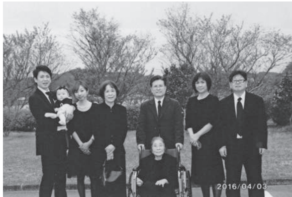
夫・三回忌の法要時（平成 28 年）