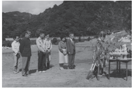
夫の退職後の新築時の地鎮祭