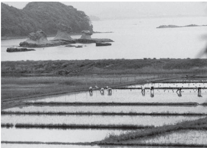
日ノ浦の裏の海(伊万里湾、人形島が見える、手前は塩田跡の水田)

期船を利用する。冬の夕暮れは早い。帰りの船を待ちながら浦の崎から眺める福島に早くもあかあかと灯が点っている。九液ガス基地の灯であり、思いがけなく美しく暖かい夜景であった。 そして、その後、福島国家石油ガス備蓄基地も誘致され、昨平成十七年十月より操業が開始されている。白い巨大タンクが八つ並んだ基地の写真を町報で見たけれど、対岸の浦の崎からの夜景はまだ見えていない。