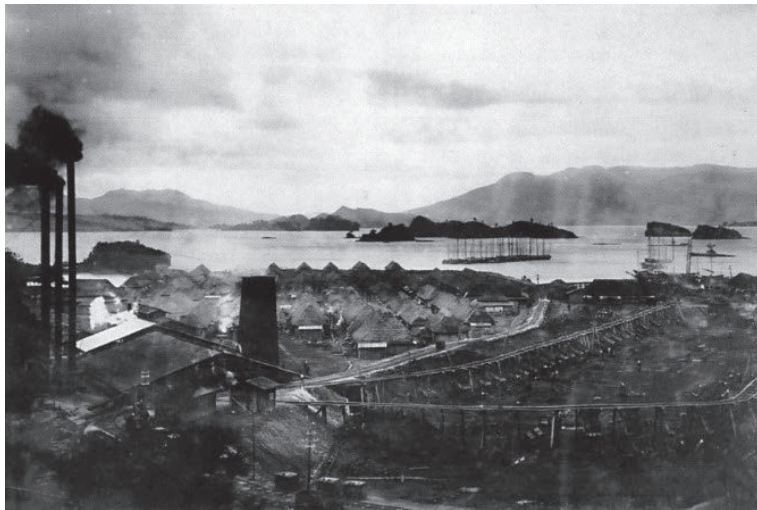
福島町・日の浦炭鉞の昔（ネットの「アトリエ仕事日記」より）

当時は島外からも多くの人たちが働きに來ていたが、その死亡後、身寄りが無い人や身許不明の人たちの冥福を祈るために、この無縁仏の墓が建てられたと聞いている。