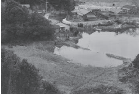
夫の退職後の新居予定地(昭和57年頃)