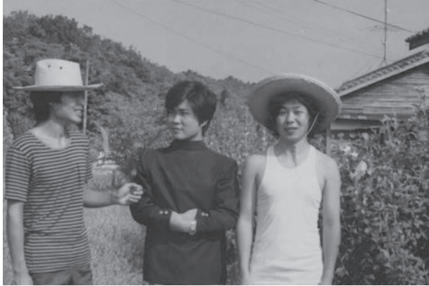
息子3人（日ノ浦の町営住宅の前で）