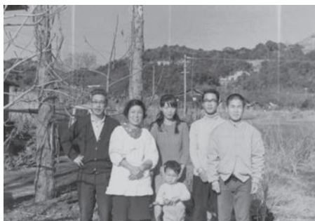
弟・武征家族他と