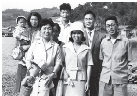
弟・侃家族やはつひ夫婦と