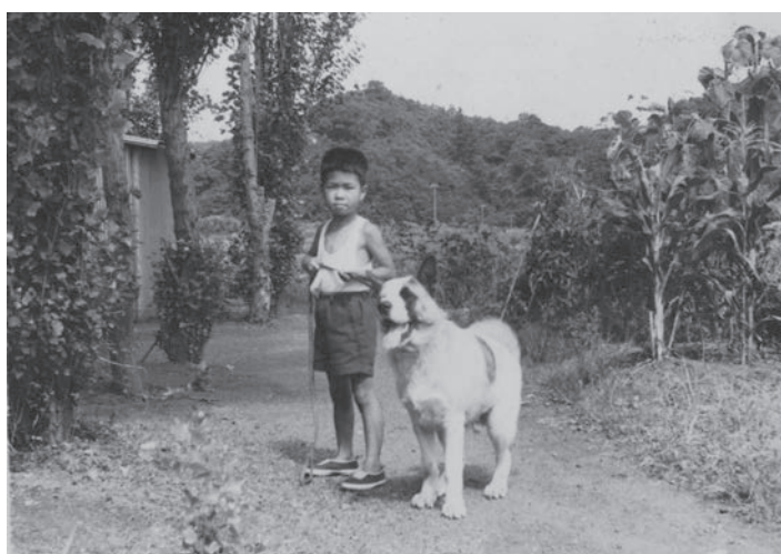
三男と飼っていた犬・アキ (日ノ浦の町営住宅前、左はポプラの木)