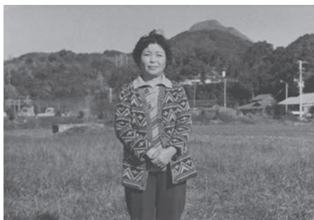
日ノ浦で (昭和51年頃、城ノ越が見える)