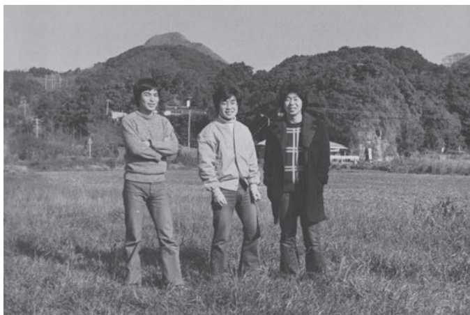
息子3人（日ノ浦の町営住宅前で）