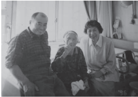
妹・節子夫婦と母